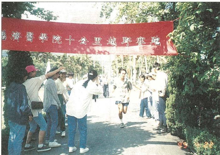
本會成立二十九周年慶系列活動之一「精舍之路十公里越野路跑」。