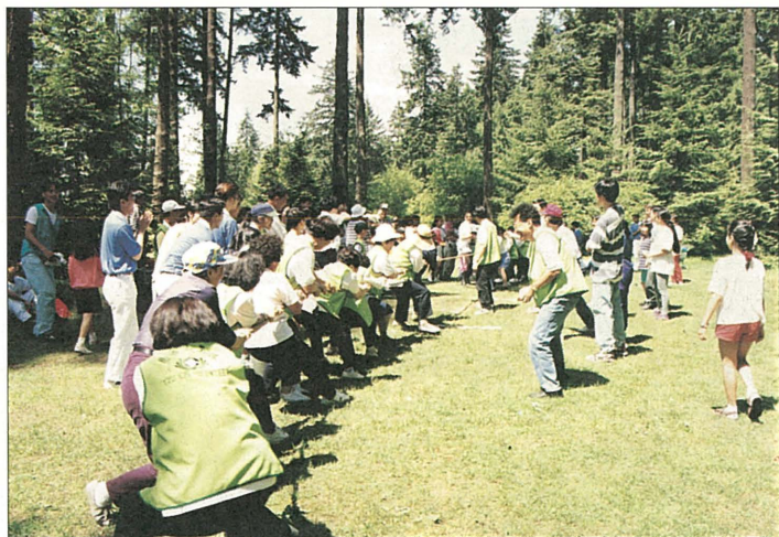
旅居加拿大的慈濟人於端午佳節在中央公園舉辦戶外活動，由慈青同學帶動團康。

84.06.03 芝加哥支會響應僑教中心舉辦的海華園遊會，並進行捐髓驗血活動、號召醫師為居民家庭義診及慈濟書籍義賣，不但為居民健康把關，也獲得當地五十二人的支持參加驗血，為待髓患者爭取生機。