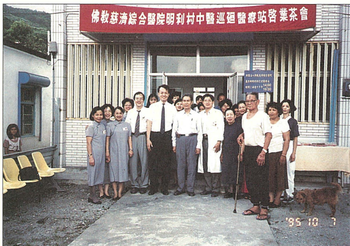
關懷原住民，慈院「中醫巡迴醫療服務」擴大服務對象，首次在萬榮鄉明利村展開中醫診療。

這一項深入關懷原住民社區的義診活動，不僅提供偏遠地區民眾除了西醫外的中醫診療的選擇，且節省遠道至花蓮市求醫的時間與金錢，尤益於行動不便的患者。