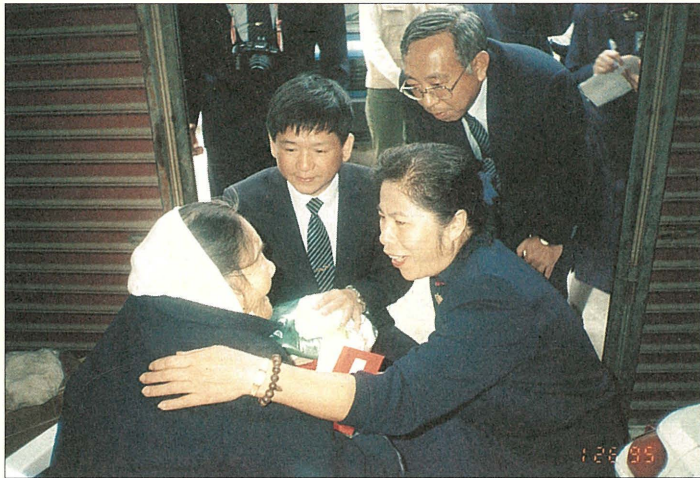
嘉義聯絡處動員一百人次進行一百五十五戶照顧戶冬令發放。