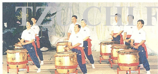
上圖：全球祈福大會中，上人帶領大家立志發願，以弘揚佛陀「慈悲喜捨」精神為己任。