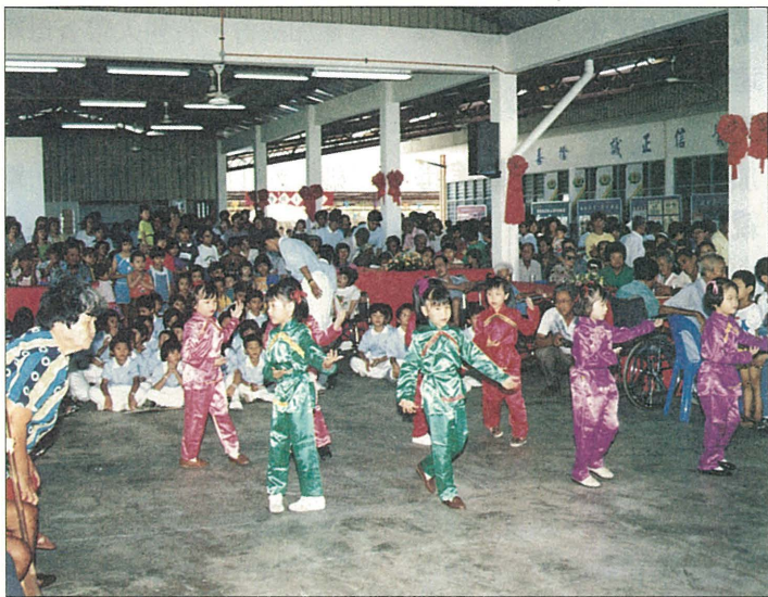
馬六甲現場發放周年慶活動中，小菩薩使出渾身解數地表演，逗得阿公阿嬤們笑呵呵。

由於馬來西亞鄰國柬埔寨多災多難，民不聊生，因此慈濟人特於發放當日舉辦國際賑災義賣會，並在現場放置東國苦難情景及慈濟前往賑濟的文宣資料，籲眾響應國際賑災。並由馬六甲仁愛醫院支援捐血活動，計有四十九位愛心人士挽袖捐血。