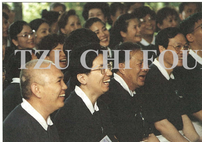
研討會學員聽聞慈濟人分享奔走志業工作時發生的趣味點滴，不禁暢懷大笑。