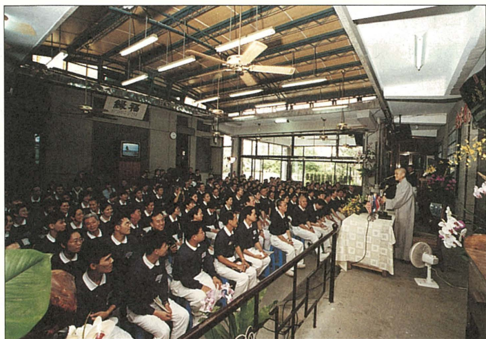
全球慈濟精神研討會，上人慰勉慈濟人的辛勞，並期勉眾人同心一志，將慈悲與善種散播到世界各角落。