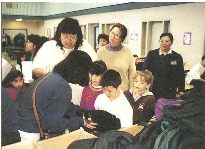
北加州發生嚴重水患，聖荷西慈濟人至帕哈洛區勘災得知洪水捲走了當地學生的鞋襪、書包及文具，以是針對需求發給學生書包及文具。

84.05.05 在慈濟美國分會精進年中，靜思堂師兄師姊除了加強自身的慈濟精神修習之外，還頻頻組團遠赴各州支會、聯絡處，分享篤於行持正信佛法的體悟，