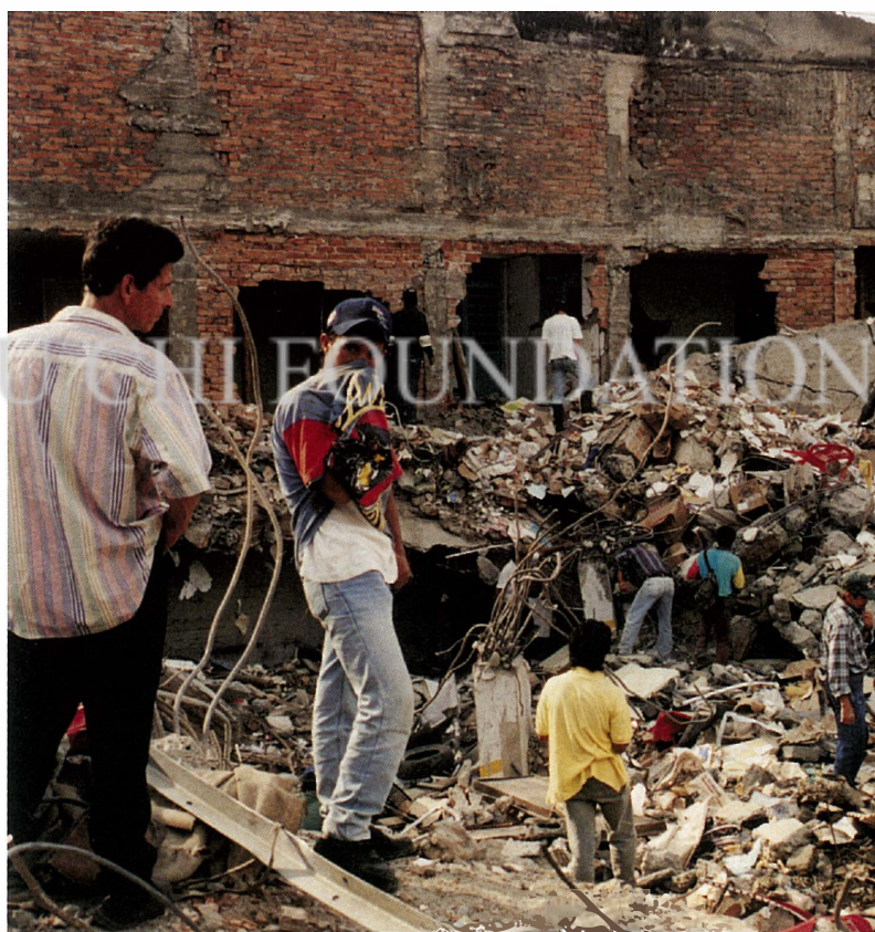
● 強震過後，家園何在？面對遍地瓦礫和斷垣殘壁，災民真不知從何收拾。

區中以亞門尼亞 (Armenia) 及柏 瑞亞 (Pereira) 兩個城市災情最 為嚴重，共一百 七十五棟大樓倒 塌、七百三十間 房屋全毀。雖然 哥倫比亞政府提 供受災戶緊急紓 困方案，並整合