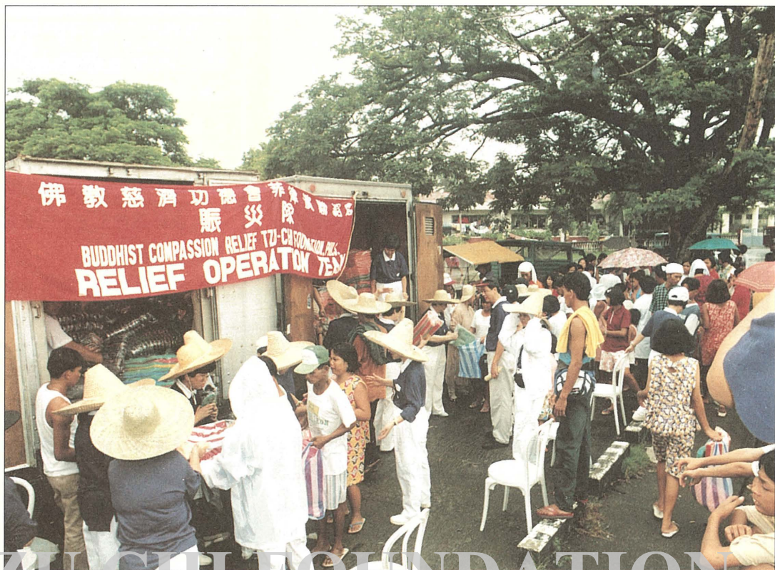
證嚴上人關切實那杜布火山泥流淹埋農村災情，指示菲律賓慈濟人緊急援輸，菲律賓慈濟人前往重災區邦邦牙省發放日用品。

勘查後獲知，無家可歸的災民疏散在六個避難中心。慈濟人訪視時，發現有的災戶一家十幾口人擠在一坪大的破舊草蓆上，有的甚至連草蓆都沒有，只好睡在紙板上；吃的僅是政府每天依戶發給的食物，往往不夠全家人吃；而晚上氣溫驟降，加上蚊子侵擾。