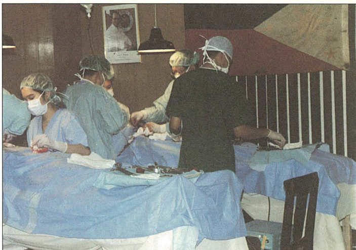
菲律賓慈濟人聯合崇仁醫院下鄉為米骨省貧困農民義診，並視病患需要就地安排開刀。

此次義診在當地造成很大轟動，米骨省三家電台也特別廣播，因此連其他省份民眾亦聞風前來求診。透過廣播，多位接受義診病人的家屬紛紛對醫師、護士和志工表示感激之情，甚至送來鳳梨、番石榴和米粟，以行動表達心中的感恩。一位甲狀腺長瘤的病人，手術後很高興地感恩慈濟人，因為開刀加上住院和醫藥費，就需要超過一萬元；然而他全年收入才只有一萬五千元，尚需負擔兒子上大學的費用，根本無法就醫，幸有此次義診，解決了他的病痛。