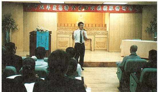
▲全省獄政機構服務研討會上，來自八縣市七十一位師兄姊就不同屬性機構服務的特殊性質，進行經驗交流。