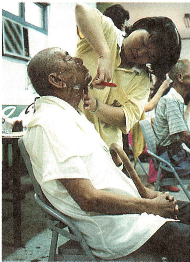
▲慈濟人至福德平宅為老人們義剪、義燙；阿公微仰著頭，眯著眼睛，露出舒服滿意的笑容。

由於離島地區居民多患高血壓、心臟病、痛風等慢性疾病，需長期診療，加上民眾反應熱烈，離島義診活動將陸續至七美鄉、吉貝村等地為民服務。