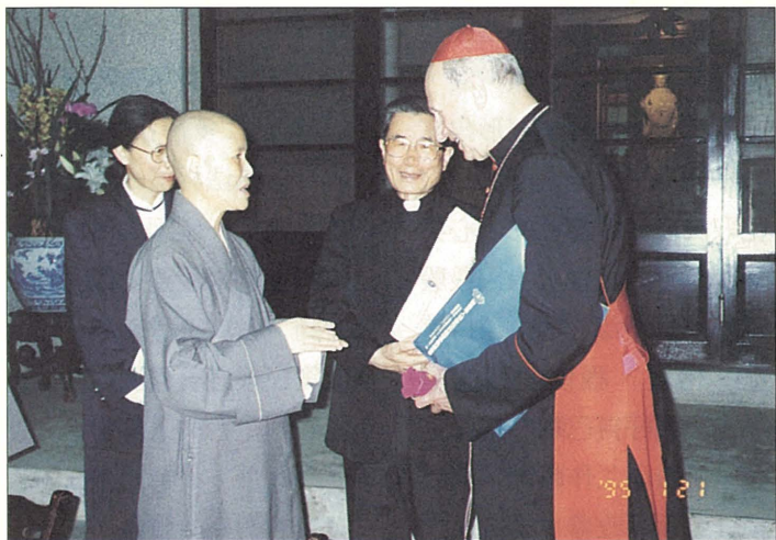
天主教羅馬教廷艾哲格樞機主教蒞臨慈濟本會參訪，並與證嚴上人雙方就宗教、世界和平等廣泛交換經驗。