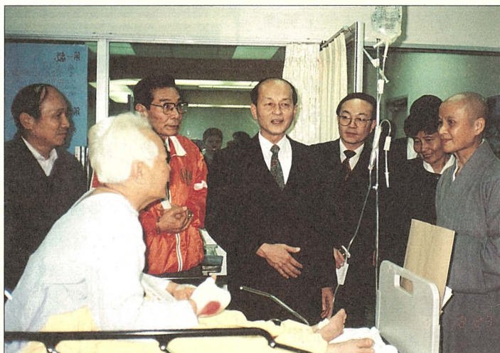
證嚴上人獲知有遊覽車在中橫遭落石擊中，立即前往慈院慰問傷者，並指示醫療費全免。

台灣省長宋楚瑜，也於次日上午抵慈院探視病患、慰問家屬，在致贈慰問金後，對慈濟所做的社會救助表示讚賞。