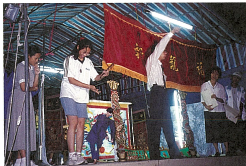
◎慈護校慶，學生們在老師傅的指導下，開心的掌控手中的傀儡。

慈濟醫學院公衛系一年級「懿德媽媽」，且是超視新聞部經理兼主播的葉樹珊，今天在醫學院週會時間，以「破與立」爲題，分享個人成功背後的「磨難」經驗，鼓勵學生賦予挫敗經驗正面評價，並且懷抱感恩心，增益己所不能。