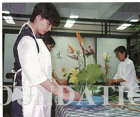
◎慈濟護專校慶系列活動之一的花藝創作比賽，每個人都神情專注的構思著。