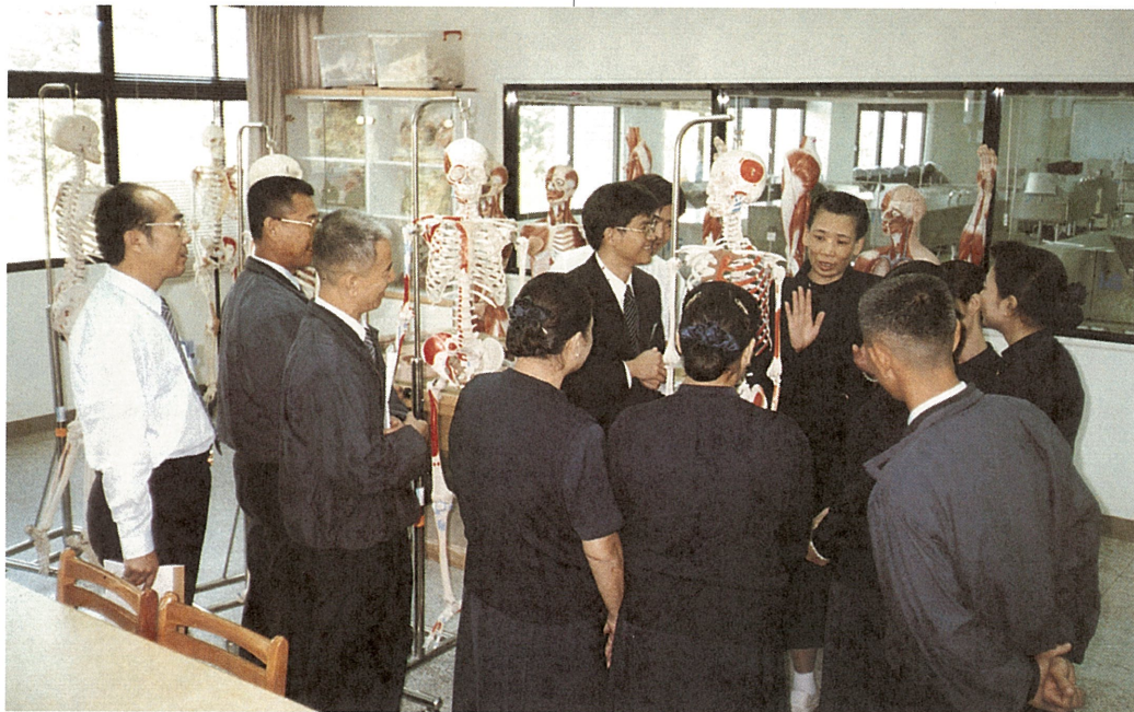
◎慈濟遺體捐贈研討會中，慈濟人透過精舍師父、慈濟醫學院解剖學科教授等人的說明解除疑惑。