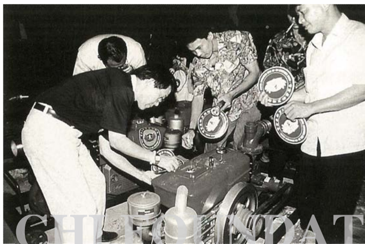
赴柬埔寨勘災，緊急捐贈抽水機

眾生」的理念，化爲「拔苦予樂」的具體行動，自一九九一年開始，慈濟就全力投入了國際人道救援的行列。從開始的生疏摸索，到後來的經驗累積，經過九年的學習淬煉，我們不敢說在國際人道救援領域中，我們有多麼傲人的成績，但至少我們敢無愧地說：我們已經盡心盡力了。