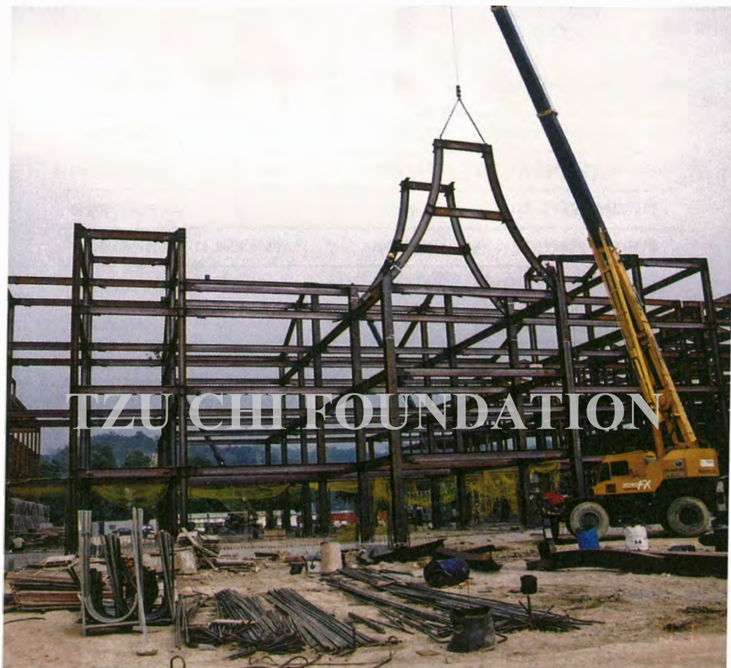
臺中縣東勢鎮東勢國小進行鋼骨吊裝工程。