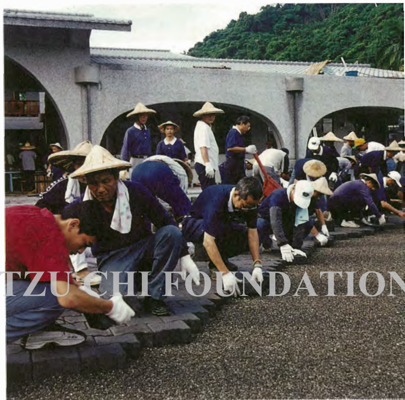
中區慈誠隊承擔起臺中縣霧峰鄉桐林國小的景觀工程，與社區志工共同鋪設連鎖磚。