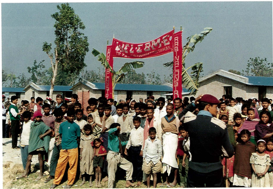
■ 遭受水患之苦，等候接受分配慈濟愛心屋的災民。

「尊重生命全球齊步走」系列活動，在慈濟委員細心策畫下，全球各地慈濟分會聯絡處與臺灣同步，進行熱烈的勸募及義賣活動，證嚴上人以身體健康狀況不甚良好情況下，仍然巡迴全省各地演講，為尼泊爾災民們的苦難請命，激發眾人的愛心與願力。許許多多的慈濟委員及師兄師姊們在大愛的激勵下，勇敢地捧著勸募箱，在機場、車站、市場等等公共場合勸募眾人的愛心；連平日忙於為病患服務的慈濟醫院員工，以及慈濟護專學生們，也利用星期假日參與慈濟委員舉行的盛大園遊會義賣各式餐飲及物品。