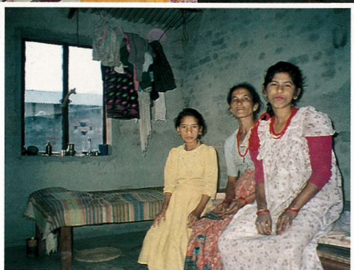
■ 慈濟人前往已於一九九四年九月發放的叙卡波卡里慈濟村，從事後續探訪；災民室內陳設雖簡陋，但起碼有一安身立命之處。

在慈濟村中，居民們果然如我們原先設計規畫時所預期，利用保留給每戶的空地種植各種花果蔬菜，來到村中，看到戶戶綠油油的菜圃，長滿了各式蔬菜水果，門前兩側種植的菊花及蒲公英迎風招搖，許多居民們更是發揮他們的藝術天分，在牆上