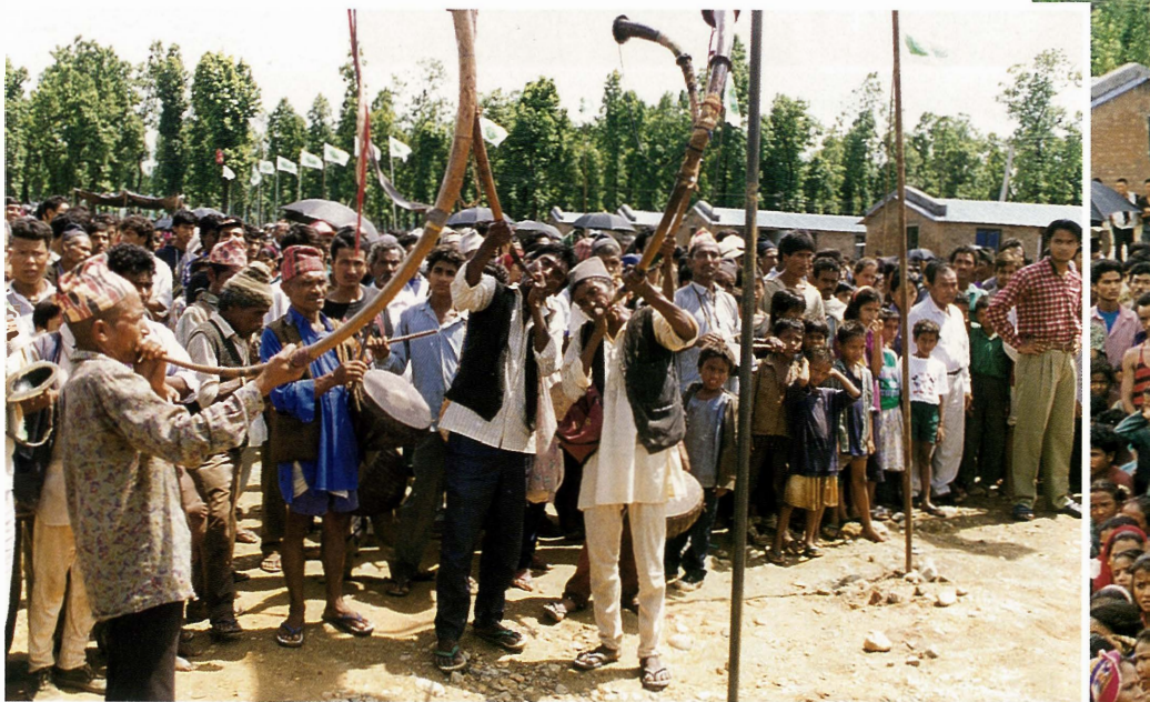
和風吹過蒼鬱的樹林，慈濟的會旗在風中飄揚著，若不是人們心中喜悅，哪能輕易聽聞傳統古老樂器的樂聲在耳邊響起。