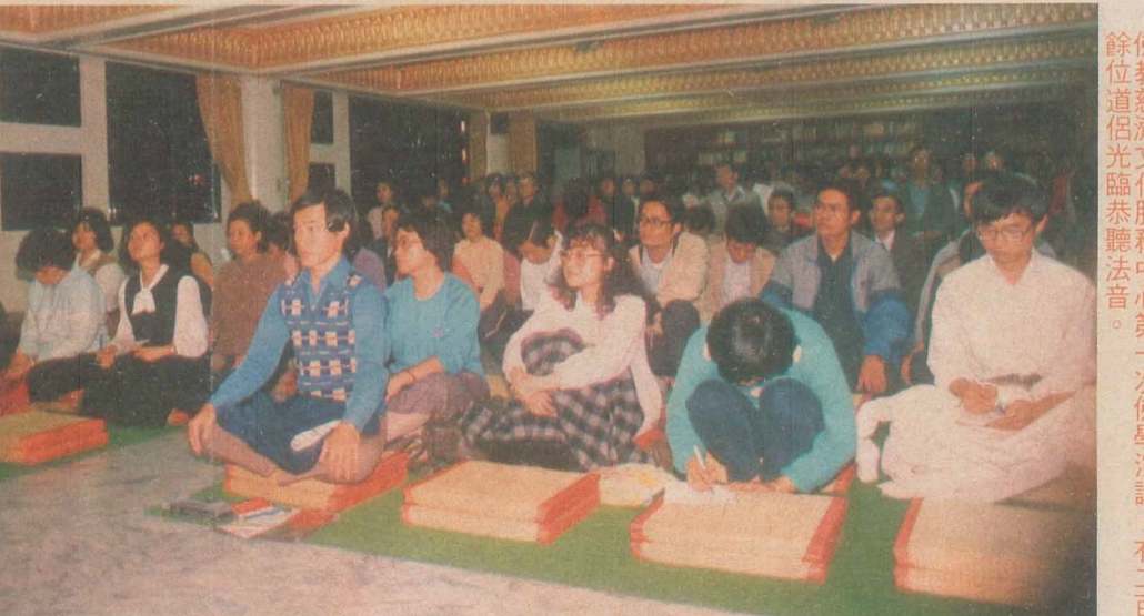
佛教慈濟文化服務中心第一次佛學演講，有二百餘位道侶光臨恭聽法音。

一位緒姓善女子對慈濟靜觀委員說：「眾位師姐，有幸隨侍師父左右，實在好幸福！」說這話時，臉上滿是祈禱的神采。踏入「慈濟」不過短短一個月，光景，這位緒姓道侶已圓滿了一百萬元建院基金，發心精進勇猛。只因她深切體悟師父的濟世悲懷，只因她視師父如佛陀再來，唯有師父才能解除眾生們的倒懸之苦。未嘗瞻仰師父之前，緒姓善女的臉上分明寫著「苦」字，緣於她所處的環境正是人生最現實的舞台，台上前呼後擁、光芒四射，是何等風光？洗盡鉛華後，比肩而過的利那竟已形同陌路。演藝圈之現實可見一斑。長久生活於此的她已覺身心疲憊。她喊著：「我找到了！我找到了！」就在返家的路上，靜觀委員看出她原先昏晦的眸子已有了光彩。當夜，她睡得好安祥。翌日，提著簡單的行囊隨同師父返家，並到慈院繞地一匝，即對靜觀委員說她願發心台幣一百萬元建院。離家之後，緒姓善女即於十月四日交台幣二十萬