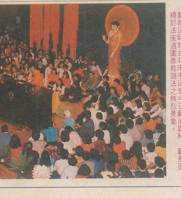
慧律法師於台北市中正堂中正廳演講時，聽眾圍繞於法座周圍恭聆說法之熱烈景象。

【本刊訊】「菩薩行」早語不出休止符的，它永遠沒完沒了；慈濟的道侶啊！奮起吧！讓我再度攜手同心，寶城的路還遠！