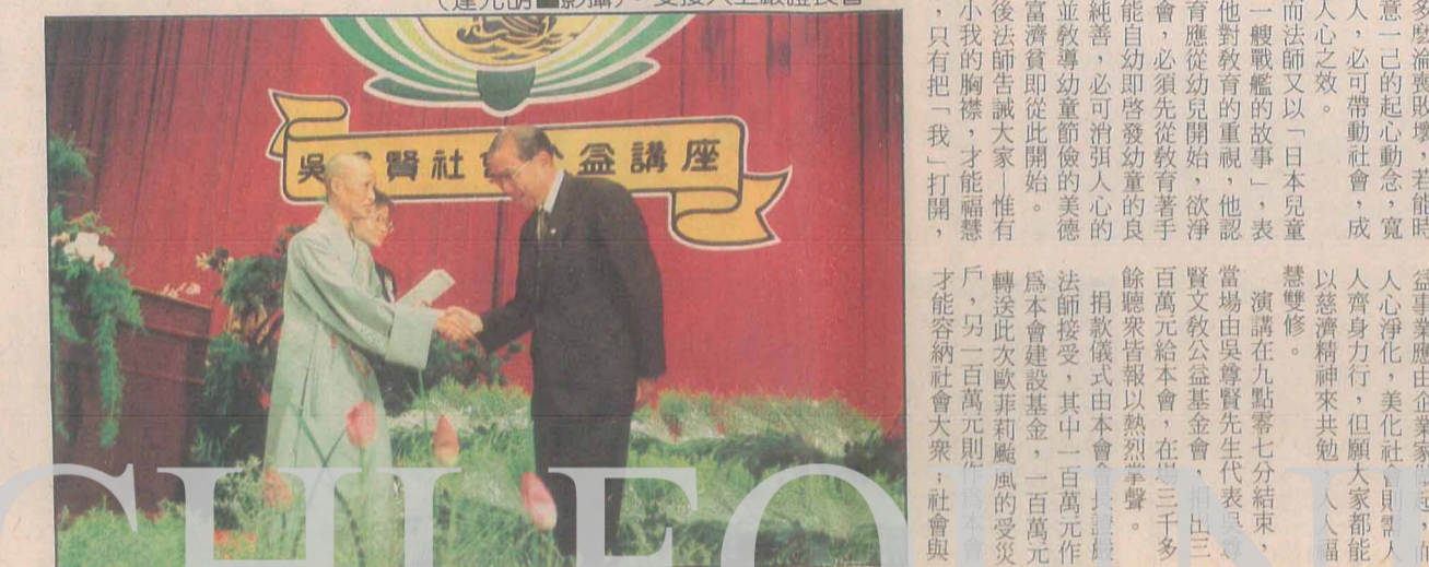
喜聞佛法滿人間 證嚴法師應邀在「佛新週刊」演講

行政院新聞局長邵玉銘先生，於七月廿八日，引領一行十餘位，前往花蓮縣進行兩天一夜的「花蓮文化之旅」。