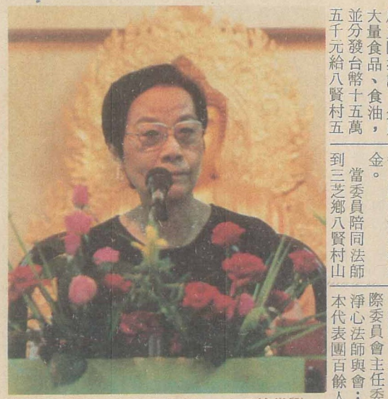
祖磨達講演心中化濟慈在，士居倫世劉。通流帶音錄製將，關精容內，行四入二的師

到三芝鄉八賢村山崩災區探訪，分贈大量食品、食油，並分發台幣十五萬五千元給八賢村五