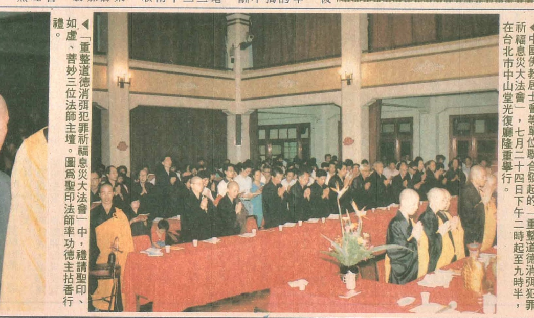
中國佛教居士會等單位聯合發起的「重整道德消弭犯罪祈福息災大法會」，七月二十四日下午二時起至九時半，在台北市中山堂光復廳隆重舉行。