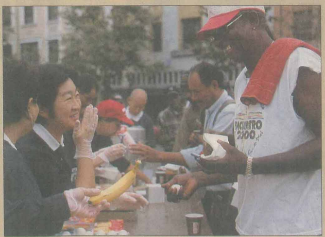
從早餐的供應到增加晚餐的服務，志工除了為街友送上熱騰騰的食物與新鮮的水果外，也傳遞關懷。

晚上八點一刻，志工們集合在 Miracle Home 兩條街口；八點半，一切布置就緒。兩條「漢堡作業線」立刻開始生產。烤好的麵包加上調味醬與四種餡料後，熱熱的漢堡一個接一個，從志工們的手中遞到街友手上。寒風中，街友拿到熱漢堡，馬上大口吃下去，蕃茄的多汁、洋蔥的甜味，再加上乳酪與火腿的鮮美，使得有些街友馬上再去排第二次隊。