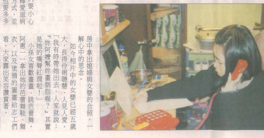
阿惠把千言萬語都藏進合十的雙手……

【返鄉】圓滿心願 王爺爺此次返鄉還有一個心願——回到慈濟人心中。雖然看不見，可是只要用心體會，聽聽上人說話的聲音，甚至能夠呼吸到上人的氣息，就心滿意足了。 六月十七日，我們陪王爺爺搭火車回花蓮。王爺爺心急著想趕到花蓮，每兩小時便按一次鈴聲，催促司機快點。王爺爺，您怎麼了？「我真的很高興，就快要見到上人了。」 王爺爺執意要行跪拜禮，上人告訴他：「您的心意我都明白，這樣就夠了！」 回程的火車上，王爺爺還是不斷訴說：「我實在太高興了，一點都不累。」快到台北時，王爺爺說：「待會兒下車，我們就叫計程車回去，我要付錢。」 「已經有住車站附近的師兄在外面等我們了！」 「為什麼這一路上都這麼周到？慈濟人實在太有效率了，你們真是一群好人！從約旦一路回到台灣，所有慈濟人都一個樣！」