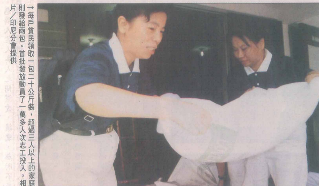
→每戶貧民領取一包二十公斤裝，超過三萬戶以上的家庭則發給兩包。首批發放動員了一萬多次志工投入。

發放現場協助維持秩序，更感恩提供三千份米糧幫助收入不豐的軍眷解決生活困境。 「阿拉真主透過慈濟志工的印，將愛傳送至印尼人民的手中，我們拿在手上的不只是大米，更是一份跨越宗教、種族的愛！」伊蘭蘭教長老希望印尼人民將慈濟人的愛永留心間，並在有能力付出時，將這分大愛散播出去。