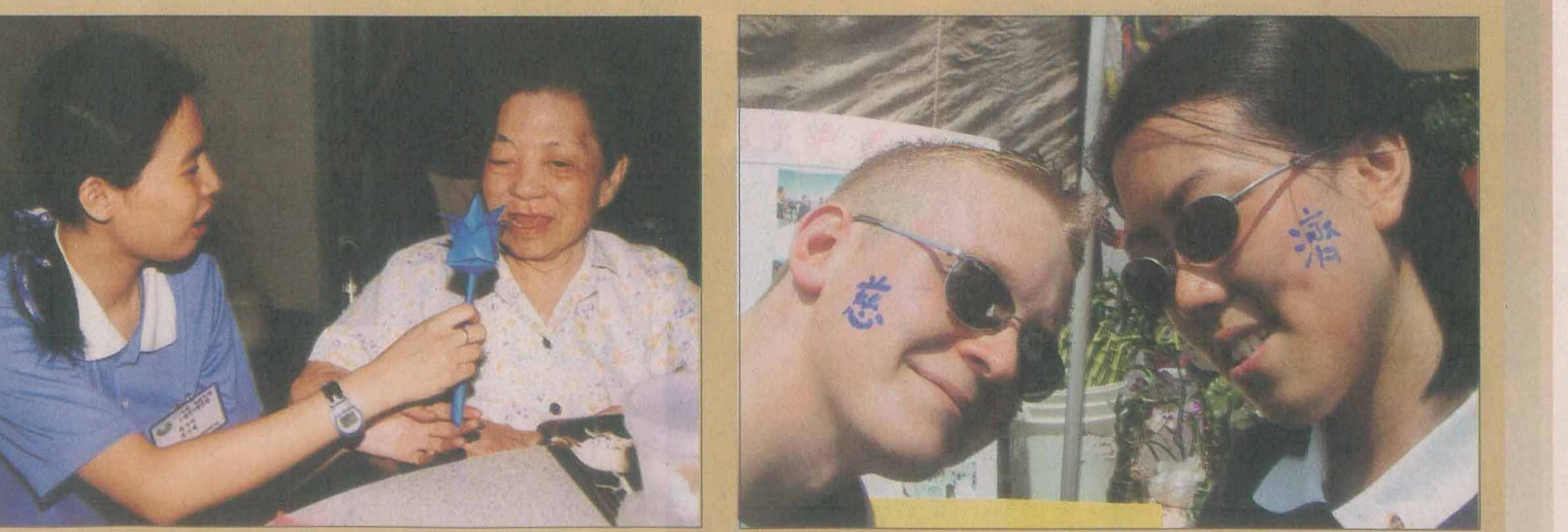
區環境、餵食及陪長輩們聊天，猶如守在膝下的孩子，把歡笑聲與溫馨送到阿公阿嬤的心坎裏。

區環境、餵食及陪長輩們聊天，猶如守在膝下的孩子，把歡笑聲與溫馨送到阿公阿嬤的心坎裏。 ↓第二屆慈青靜思營學員前往喜樂之家服務，關懷與暖意在心與心之間流動。