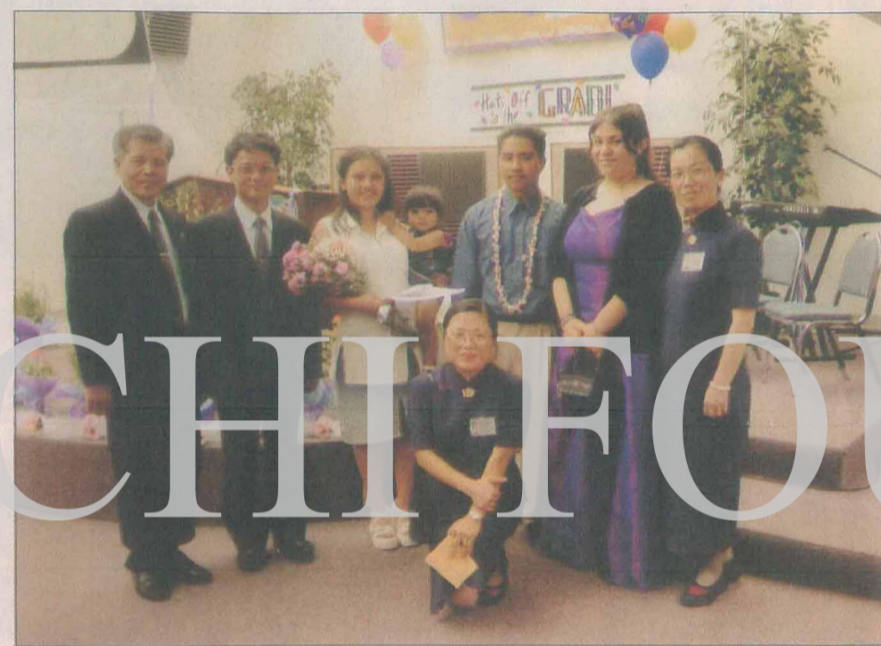
慈濟志工出席 Cielo 社區中學畢業典禮，祝願這些曾在年少時求學中輟的學生能開拓出自己的人生大道。