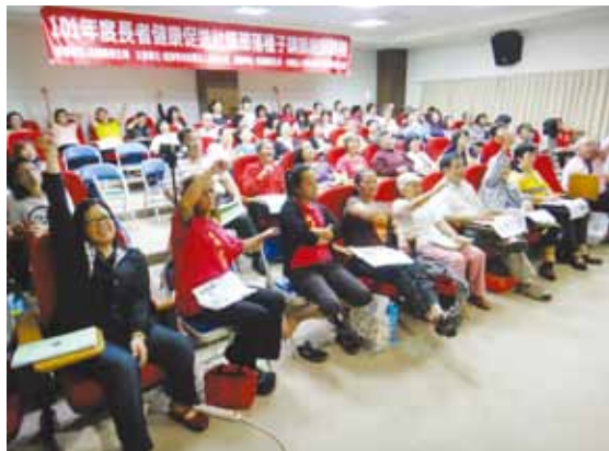
花蓮縣衛生局委請慈濟大學辦理「長者健康促進」社區部落種子講師志工培訓，志工回到社區就近推動老人照護。

尤以花蓮縣人口外流嚴重，加上近年生育率普遍降低，老年人口成長更是快速，已是不容忽視的警訊。有鑑於此，花蓮縣衛生局委託慈濟大學，培訓「長者健康促進」社區部落種子講師。課程包括老人溝通技巧與實作訓練、用藥安全、健康照護管理、安全環境與園藝、長者健康促進的社會支持與評估、團康活動帶領