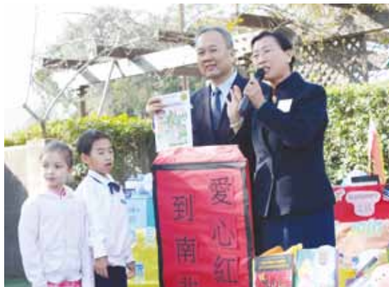
美國慈濟大愛小學的孩子們新春獻禮，送給南非貧苦兒童一個個「大紅包」。

「送愛到南非」贈書計畫是慈濟美國總會2004年所發起，每年由全美各地慈濟人文學校師生家長總動員，募集書本文具，作為新年禮物送到南非。