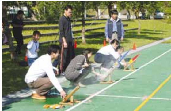
各組親子利用氣體壓力原理，合力製作水火箭，參加射程比賽，體驗科學的樂趣。