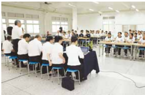
泰國清邁慈濟學校2012年6月1日首次舉辦慈濟人文教育評鑑，檢視人文課程教學成效，晚間全校教職員出席聆聽評鑑建議。