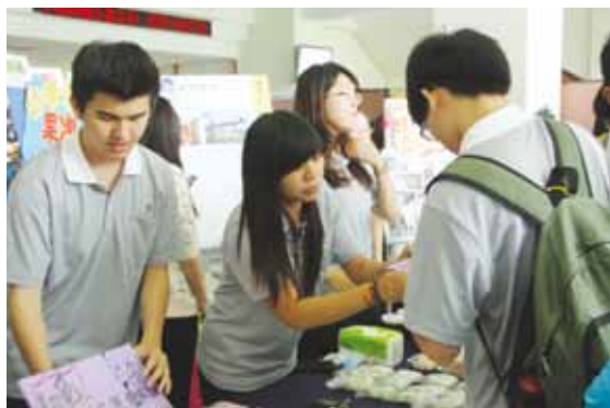
慈濟大學分子生物暨人類遺傳學系學生，義賣各種異國美食，所得善款全數捐助弱勢團體。

服務學習推動至今，已有師生一千九百零七人投入服務，服務時數高達兩萬六千零四十六小時。服務學習組組長陳建智表示近年慈大服務學習概況，其特色在於融入慈濟人文精神，並依不同院系屬性規劃不同服務活動，很有系統地持續推動，使學生從活動中學到更多。