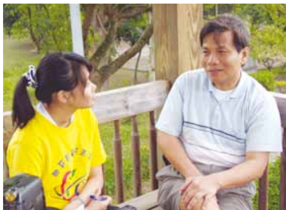
慈濟技術學院資訊志工團隊推廣社區文化數位典藏，規劃「溫馨小故事」主題，由學生採訪鄰近社區人士，挖掘富有地方特色的人物故事。