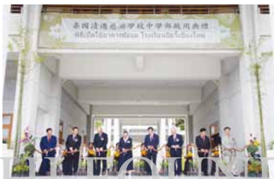
泰國清邁慈濟學校中學部校舍落成啓用，慈濟基金會及泰國各界來賓代表蒞臨剪綵，歡慶誌喜。

當天由慈濟基金會教育志業體師長、建築委員會委員，以及泰國各界人士代表剪綵，有形的硬體建設完成之後，親師生將會持續深耕慈濟品德教育。