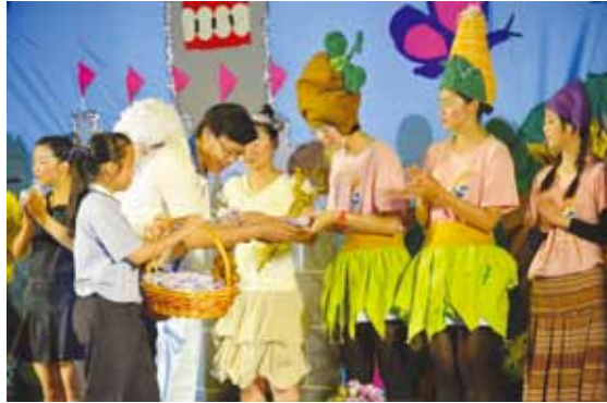
慈濟技術學院《美國的美麗果》兒童劇公演，演出結束後由吉華K校校長頒贈結緣品。

馬來西亞少有華語兒童劇場，慈濟技術學院學生的兒童劇演出，已成為當地社區一大年度盛事。