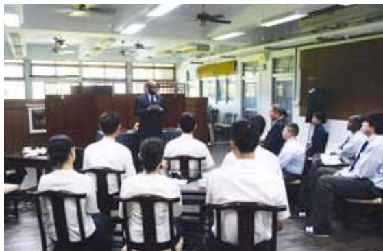
美國歐巴馬男子學院與慈大附中6月18日簽定合作備忘錄，校長道格拉斯致詞感恩美國慈濟志工幫助孩子就學。