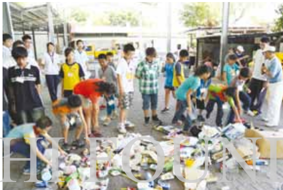
「2012年山海樂活籃球人文營」環保課程中，學員們到花蓮環保教育站體驗資源回收，學習正確分類。

4至6日，營隊活動在慈濟大學登場，展開籃球、國術團康活動、環保站實作、生活保健、反毒宣導等一系列的人文課程，期能培養學童行善行孝、良好的生活習慣、衛生保健知識，以及正向價值觀。