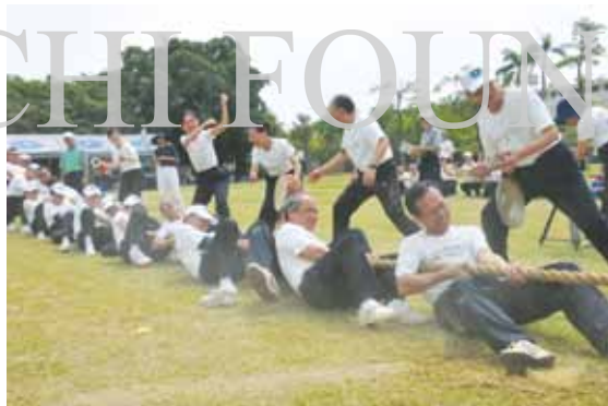
慈濟大學社會教育推廣中心十五周年慶運動會，全臺十二個社教中心同仁、學員於岡山志業園區同場較勁。

2006年，因緣殊勝，慈濟基金會取得高雄縣岡山鎮私立立德商工職校校地，作為岡山志業園區，並於隔年成立「慈大岡山社會教育推廣中心」，開辦各種課程。原校地即擁有廣闊的操場，慈濟大學社教中心在屆滿十五周年之際，擇此舉辦運動會，也是中心迄今最大型的聯誼會，藉此互動，凝聚人人的共識，也期許在邁入第十六個年頭，能繼續落實社會教育，推出更多課程，邀請民眾享受終身學習的樂趣。