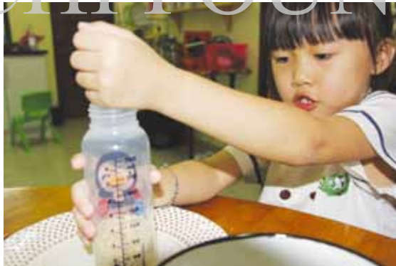
馬來西亞慈濟大愛幼兒園的孩子在家中日存一把米，把白米放進自己的奶瓶捐出。

「米撲滿」行小善、化大愛的效應，走入校園，讓師生突發奇想，推行「奶瓶米撲滿」，一方面鼓勵孩子日存一把米到奶瓶裡行善助人，另一方面也鼓舞孩子捐出自己使用的奶瓶，趁機讓他們戒掉使用奶瓶的習慣。對於幼童而言，奶瓶是自己的寶貝，父母親常須費心力才能讓孩子停用，但在推行「奶瓶米撲滿」善舉之後，已有三十位小朋友成功戒掉使用奶瓶的習慣。募集而來的這些白米，以精美小袋分裝，作為籌募慈濟教育中心、洗腎中心建設基金的結緣品。