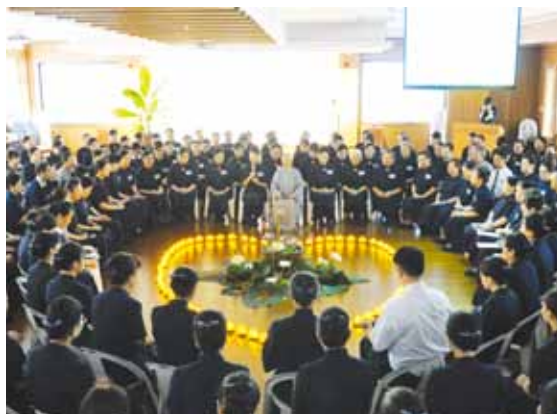
「2012年靜思茶道、真善美花道海外專班」6月14日圓緣，靜思精舍常住師父蒞臨點傳心燈。

因應「全球四合一幹部精進研習會」6月中舉辦，特提前安排此專班課程，透過本次研習，讓種子學員回到僑居地，能藉由花道藝術分享及茶道人文交流，將慈濟人文精神傳到世界各地，進一步擴大人間菩薩招生。