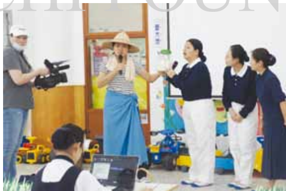
慈大附中兒童節系列活動之一靜思劇場，由大愛托兒所老師演出緬甸米撲滿的故事，向孩子們傳達知福惜福的觀念。