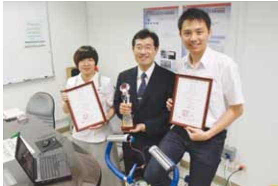
慈濟大學醫學資訊學系師生，開發智慧型腳踏車，輔助使用者擬定健康管理計畫。 攝影 / 李家萱

環保科技日新月異，發揮巧思，代步工具也能變成生活好幫手。醫資系師生設計可拆式手把，搭載微控制器（Micro-controller Unit, MCU）技術，裝在腳踏車上，只要輸入使用者身高、體重、年齡，擷取心臟傳至手掌的電流，儲存、分析、記錄卡路里消耗、心率、心電圖、運動時間等數位化資訊，可作為個人健康管理的參考。