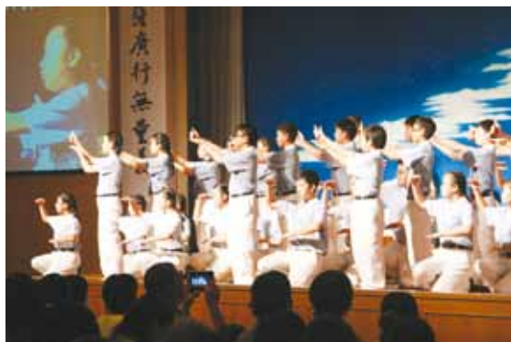
馬來西亞馬六甲慈少 班演繹〈悟達國師傳 奇〉。

生活中落實簡約環保，也讓親子關係更加融洽；很多家長也趁此機會交換意見，對教學多表肯定。馬來西亞馬六甲分會今年首次採用《無量義經》教案，十個兒童親子成長班以〈德行品〉為課程主題，結合靜思語教學，讓孩子得到有益人生的啟發。