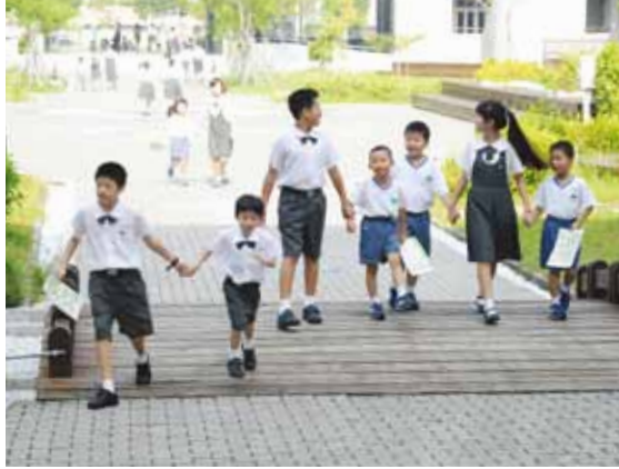
新生始業活動「大手牽小手」六人一組，勇闖校園內各處室、專業教室十八關。