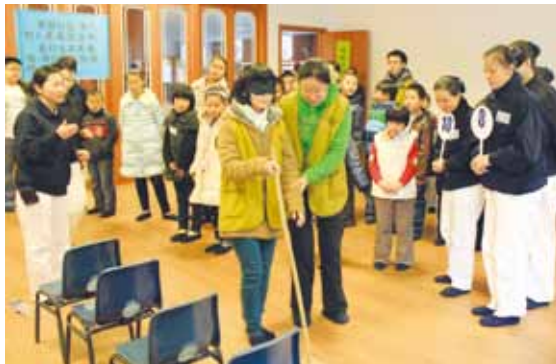
廈門聯絡處親子成長班學員互換扮演盲人、引導者，體會伸手助人的快樂。