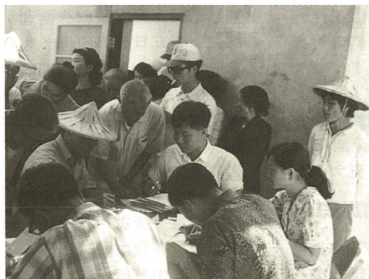
■本會委員在台東第三次施藥義診，現場協助參與義診之貧民辦理各項手續。

11.4 本會工作人員一行五十多人，今在上人率領下，前往玉里辦理「娜拉」颱風賑災發放救濟金、慰問金及棉被衣服等救濟品工作。