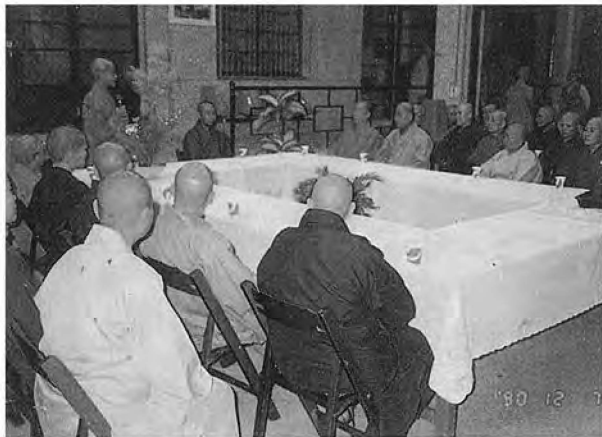
▲台南溪十三位除出家眾專家來程會參訪