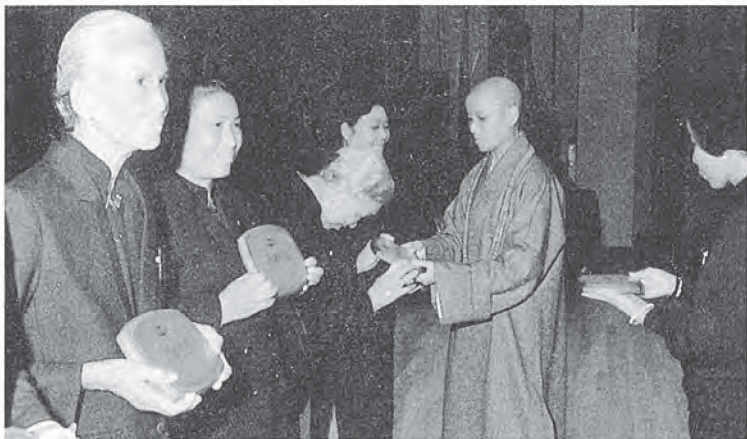
▶七十九歲的靜煥師姊（左一）獲頒全勤獎座

上人談到十六日在板橋的演講，那天下午，身體不適，不免擔心如何講完全場，尤其講到半場，半身都麻了。但眼見委員與慈誠隊那份熱忱與盡責，心中實在非常感動和感激，特地延長說話的時間，多說了些話，否則就對不起大家的辛苦。當演講完畢時，心中好高興，又通過一關了。