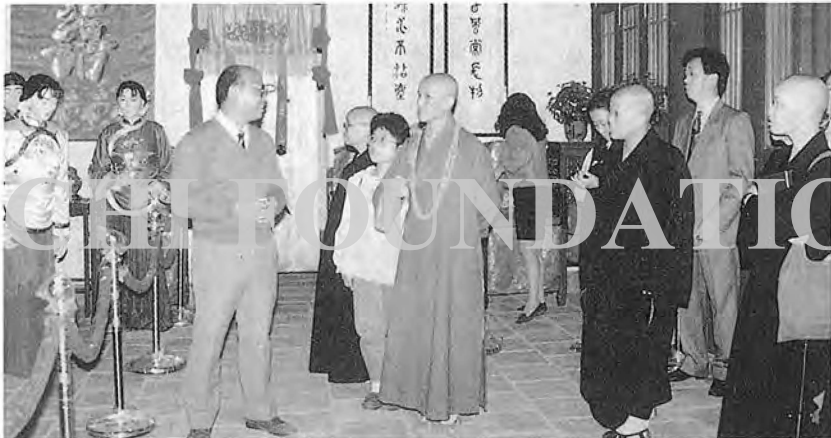
▶ 上人率眾參觀「昨日世界」蠟像館

台中分會自七十五年農曆二月一日，由香雲精舍遷移到民權路，已將近五年。五年來，分會這個據點充分發揮了宣揚慈濟的功能，不僅會員從數千人增長到十四萬的會