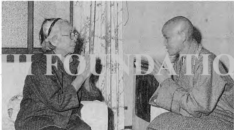
▲孫夫人與師父長命百歲，說十合手雙夫人

問：「師父要不要參觀他們的慈濟工廠。」上人當即隨之上樓參觀其電動刺繡工廠，簡居士夫妻倆常利用生產線空檔時，親自操作慈濟結緣的生日紀念章及各項結緣品。夫婦倆一念誠心追隨上人於慈濟道上，令人感佩。