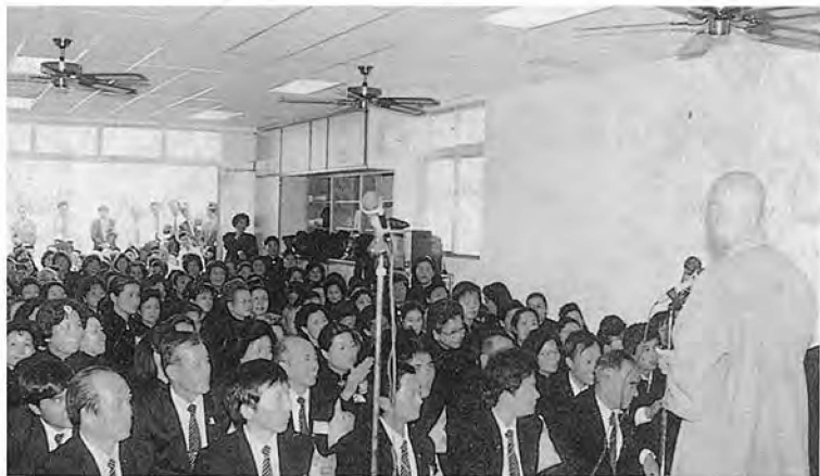
戒八守堅要也，量重不質重隊誠慈東台，說人上▲