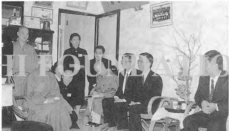
氣氣的美最中體團是氣和，說人上▲