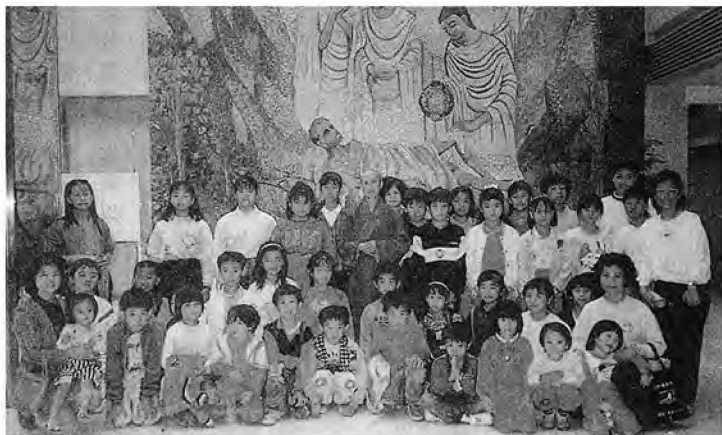
友朋小的來穗瑞見接空撥地特中議會在人上▼

濟人說道：「雖然我們距離遙遠，但我們的心是常在一起的；我相信各位只要有佛心、有師志，慈濟志業在美國是前途無量的。希望你們把佛教的正法，慈濟的精神，積極