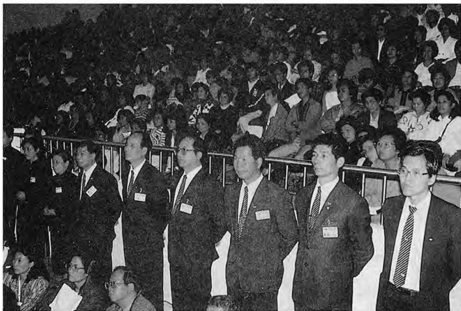
►體育館偌大的會場全賴慈誠隊一一清掃整理

一位朋友因先生有外遇，到我家裡哭哭啼啼，說要離婚，我只好拿師父開示的錄影帶讓她帶回去看。當