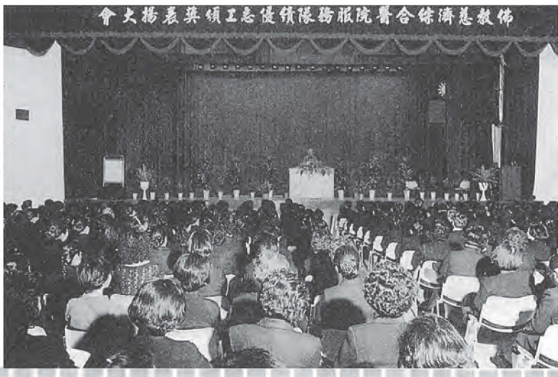
▶上人對台北區的慈院志工語多勉勵

不大。而你們男士有董事長、事業家，選擇了慈誠隊，會令人刮目相看，慈誠隊是慈濟的智慧命脈。」簡居士特地將家中的倉庫改建佈置，做為慈誠隊共修的場所。鋪