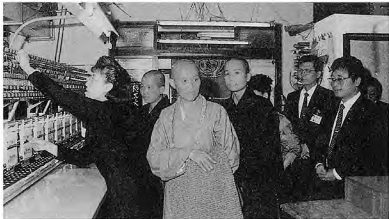
▲上多人參觀簡師的刺繡工廠