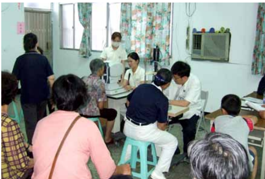
■ 太麻里老人家多，眼科門診座無虛席。

這一整天下來，發現透過人醫會的醫療服務真的帶給這些偏遠地方的人民很大的便利性，在這些居民的眼中，可以看到他們對慈濟的感恩，而參與義診的所有醫護、行政同仁，更因此而體會「助人的同時，也是在淨化自己！」這句靜思語的涵義。（文／莊朵雲、李婉琪、黃坤峰）