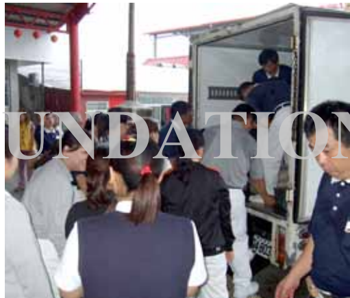
■ 參與人醫會義診的志工和醫護行政人員，協力將各種器具搬下運載的車輛。