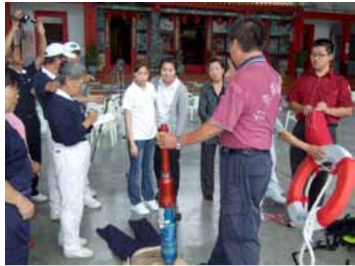
■ 消防局人員配合人醫會，在義診前教導民衆各種緊急救護方式。

行政人員一下車後也開始分配工作，當花蓮慈院的行動醫院抵達看診會場時，大夥兒幫忙搬運設備、藥物箱以及