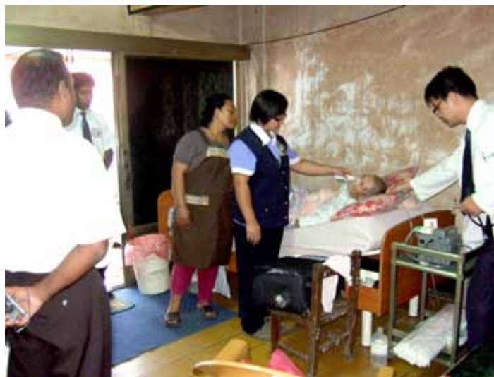
■ 跟著居家往診、關懷，學習偏遠地區結合慈善醫療、和居民們親如一家的模式。

蘇木度醫師等人表示，斯里蘭卡的部落亦像海端鄉部落般，因為交通不便而思想封閉，無法接受外來的改變，甚至只相