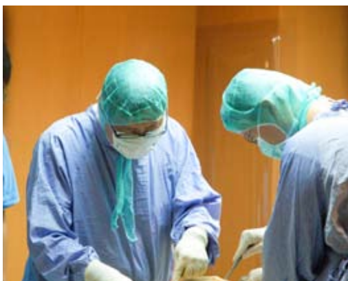
■ 於今年七月二十一日，花蓮慈院完成第三百例病理解剖，感恩每一位將已無用的軀體奉獻給醫學教育與臨床研究的病患與家屬。攝影／曾慶方

到目前為止，我們病理解剖的人數已經三百位了，從一到三百，每一個案例的編號，代表的是我們一步步探索人體奧妙的生命密碼。