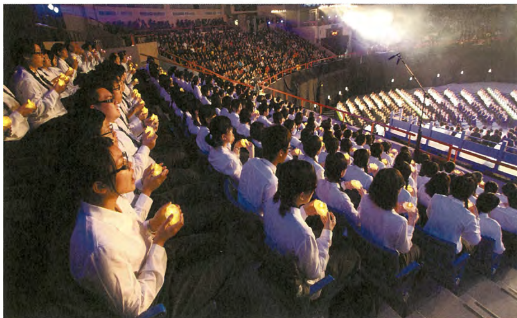
「大愛之光區」裡慈濟大學、慈濟技術學院學生與臺下演繹人員相互呼應。