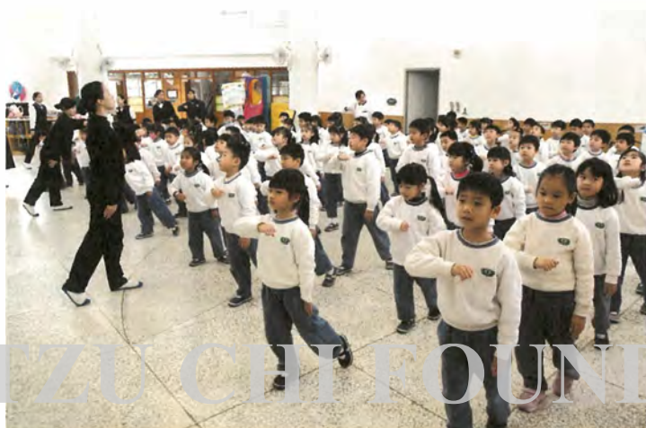
慈大附中附設幼兒園的學生進行動線隊形與手語演練。