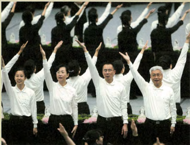
參與水懺演繹，讓曾國藩（中）彷彿回到早期念書時期把人文道德的課本內容，印證在日常生活中。